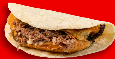
CHILE DE CARNE $27