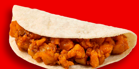
PAPA CON CHORIZO