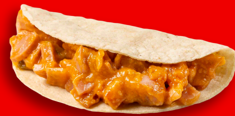
JAMÓN CON QUESO