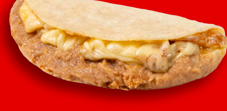
QUESO CON FRIJOLES