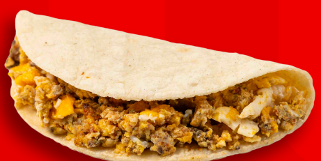
CHORIZO CON HUEVO