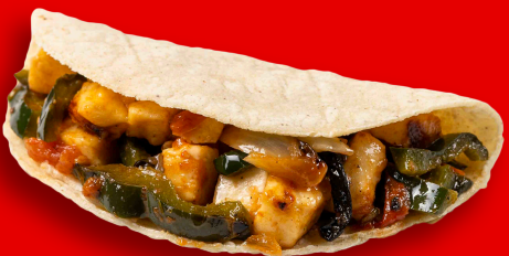
RAJAS CON QUESO