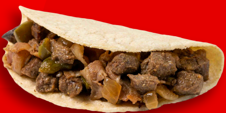
CARNE CON TOCINO