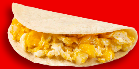
PAPA CON HUEVO