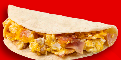
JAMÓN CON HUEVO