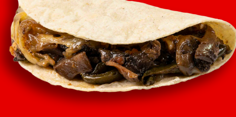
CHAMPIÑONES CON QUESO