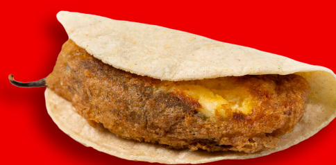
CHILE DE QUESO $27