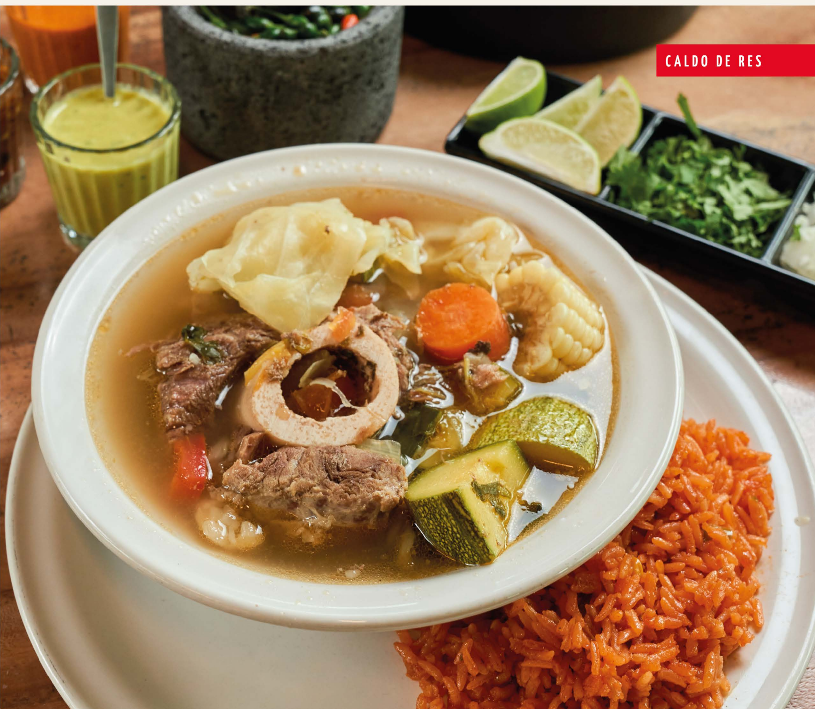
CALDO DE RES

Tierna carne de cabrito cocinada a la perfección en salsa típica regional. Acompañado de arroz rojo, frijoles refritos y ensalada.