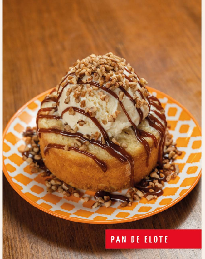
PAN DE ELOTE